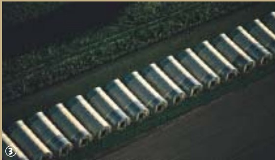
Alignement de serres.

La Pévèle située à proximité de l'agglomération lilloise, s'étend de la Belgique à la plaine de la Scarpe ; plus précisément elle est délimitée par la Scarpe au sud, la Deûle à l'ouest, la Marque au nord et l'Elton à l'est. Dans ce pé-