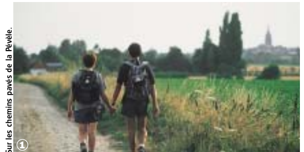
Sur les chemins pavés de la Pévèle.

Mérignies, Tourmignies, Mons-en-Pévèle (9 km - 3 h 00)