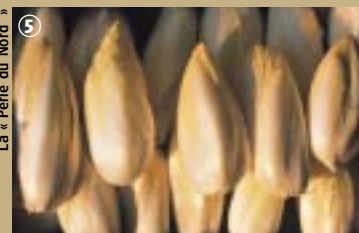
La « Perle du Nord »

semble : en salade, en gratin ou même en potage, quel régal !