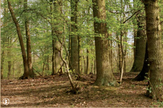
Forêt de phalempin.

N'est-il pas délicieux de faire l'école « buissonnante » dans les forêts et les espaces naturels régionaux ? Poumons verts, vitaux pour nos villes, ces espaces boisés offrent un concentré de verdure !