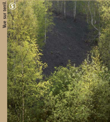
Vue sur terril.

Le promeneur doit savoir que les coupes d'arbres sont nécessaires à la gestion de cette forêt, située à 15 km de l'agglomération lilloise, qui accueille un public de citoyens, venus se détendre au cœur des arbres ou au bord des étangs.