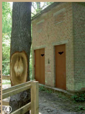
Abri à chauve-souris.

A quelques enjambées de Lille, cet ancien bassin de décantation des boues de lavages des betteraves à sucre s'est métamorphosé en un bel espace humide devenu un site ornithologique exceptionnel. Si vous n'avez pas la chance de le croiser « en vrai » au détour du chemin, des sculptures en bois symbolisent les animaux, hôtes de ces lieux. Ne soyez pas effrayés ! Tendez la main et caressez chouette et chauve-souris ! Vous trouverez également des panneaux d'interprétation illustrant la faune et la flore présents sur le site. N'oubliez pas vos jumelles ! Vous apercevrez, sans doute, entre deux plongées, les grèbes à cou noir. Laissez-vous charmer par d'autres oiseaux rares et menacés comme l'Avocette élégante ou la Mouette mélanocéphale. Et épiez, au creux des mares, le triton alpestre qui vient respirer en surface.